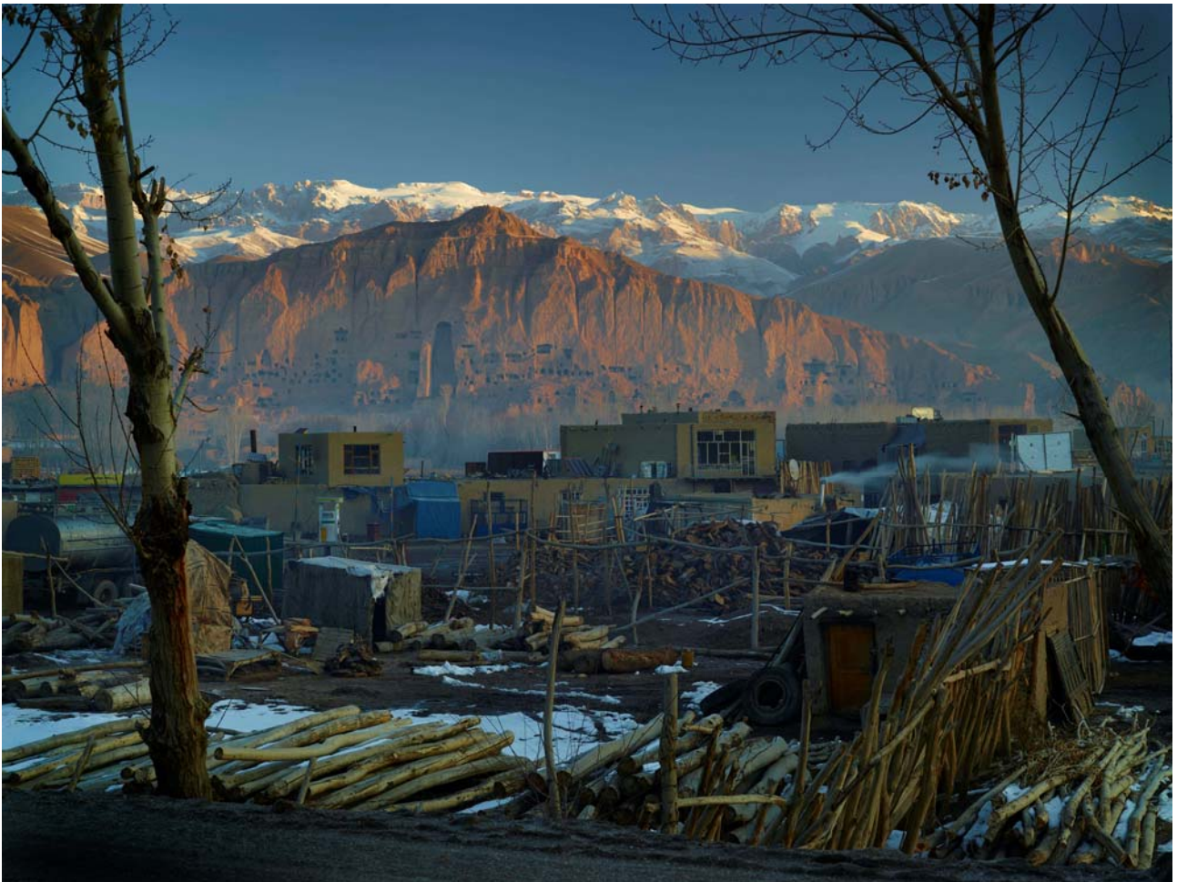
Simon Norfolk, A Disaster Season , 2013

Alt.+1000, Festival de photographie de montagne, Rossinière, CH, biennial, 13.07. - 22.09.2013