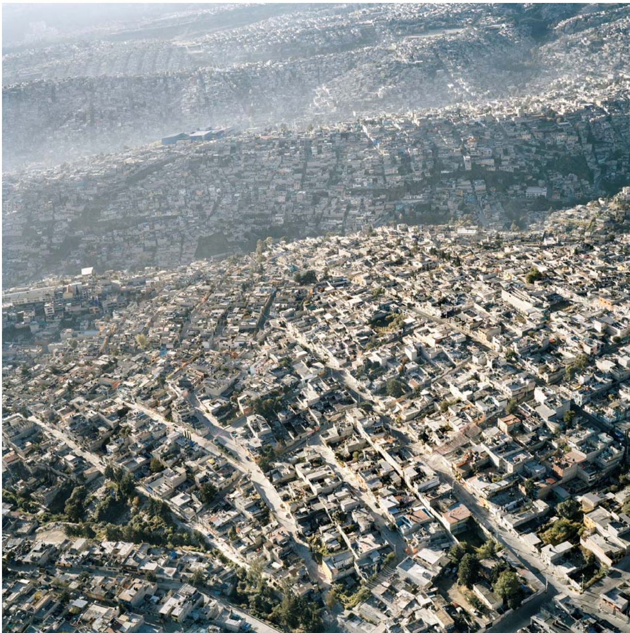
Pablo Lopez Luz, Aerial View of Mexico City XIII , 2006

Alt.+1000, Festival de photographie de montagne, Rossinière, CH, biennial, 13.07. - 22.09.2013