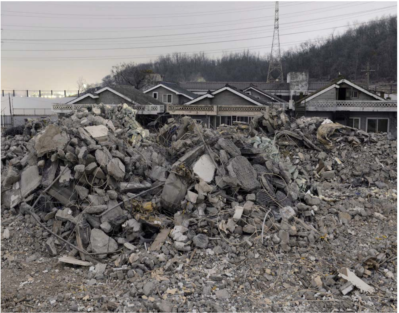
Jihyun Jung, Luone City 05 , 2013

Alt.+1000, Festival de photographie de montagne, Rossinière, CH, biennial, 13.07. - 22.09.2013