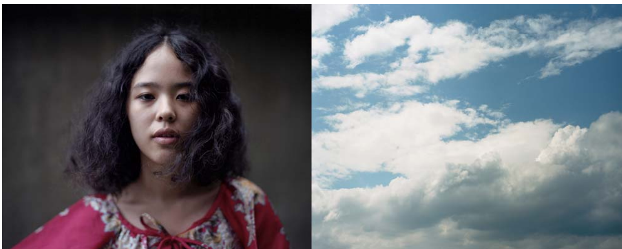
Geehyun Han, You are the Nature , 2012 © Geehyun Han/Chung-Ang University, Seoul